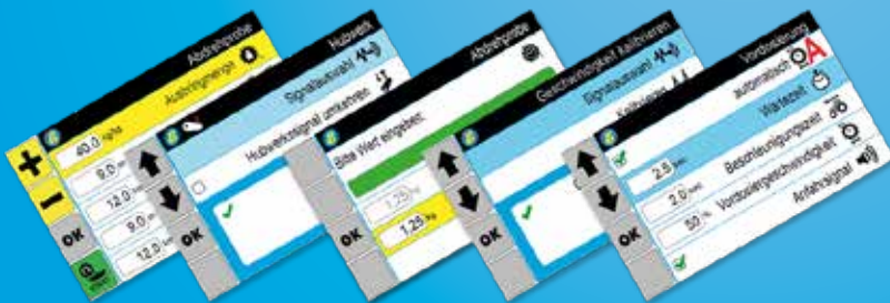
Unterschiedliche Menüs der STI-Steuerung