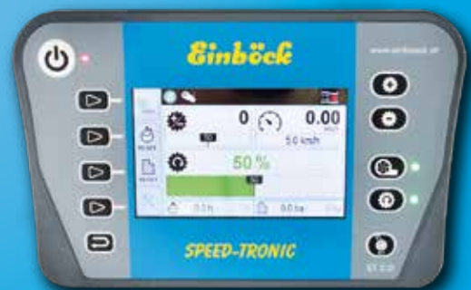
Das Bedienterminal der STI-Steuerung