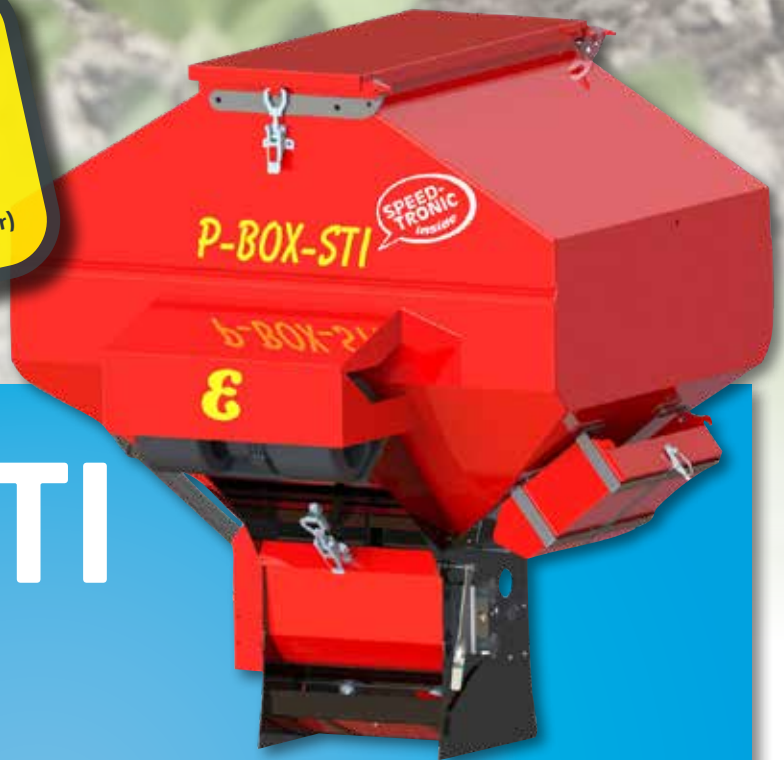
Geeignet für viele verschiedene Saatgutsorten!

exkl. MwSt., EXW Österreich Frachtkosten für Grundausstattung € 140,00 Weitere Ausrüstung (wie notwendiger Geschwindigkeitssensor) optional erhältlich!